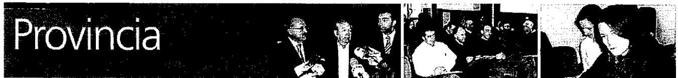
PÁG. 23: NUEVA LEY DE BIBLIOTECAS 24: JORNADAS BIODIVERSIDAD EN ENGUÍDANOS 25: COLEGIO DE LAS PEDROÑERAS